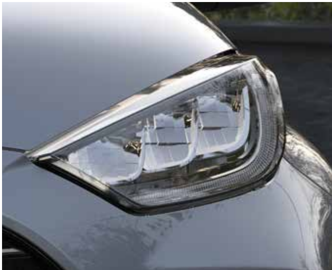
Phares avant LED et clignotants LED