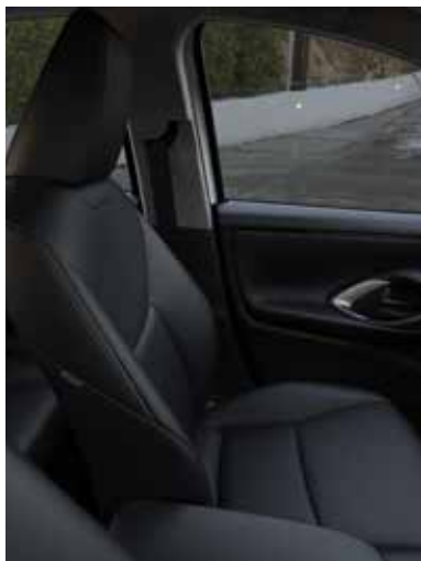
Sièges en tissu noir (PURE)