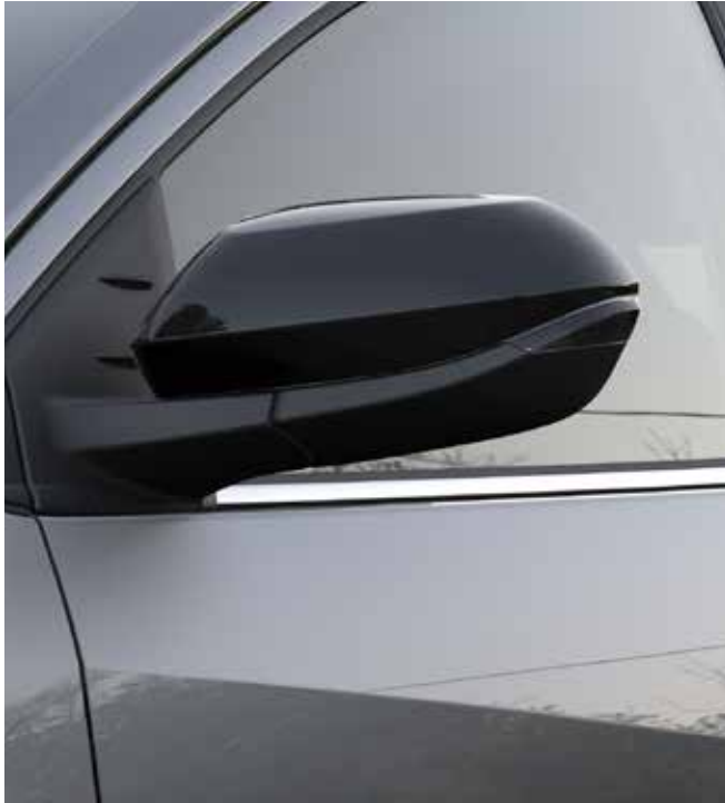
Rétroviseurs réglables électriquement, chauffants, rabattables automatiquement et coques en noir