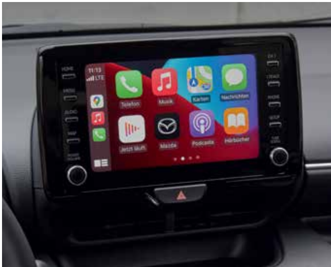
Écran tactile en couleur 8" et Apple CarPlay™