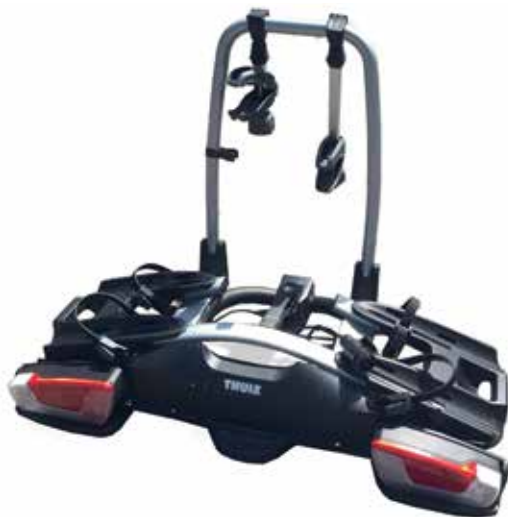
Thule porte-vélos Coach 274