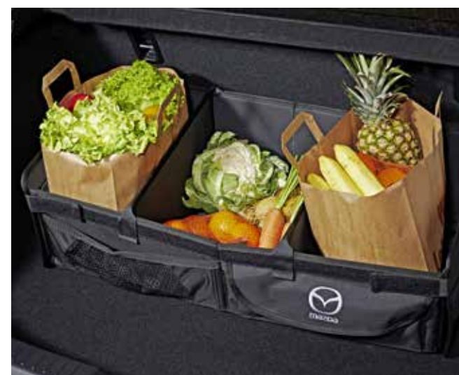
Boîte de rangement de cargaison pliable