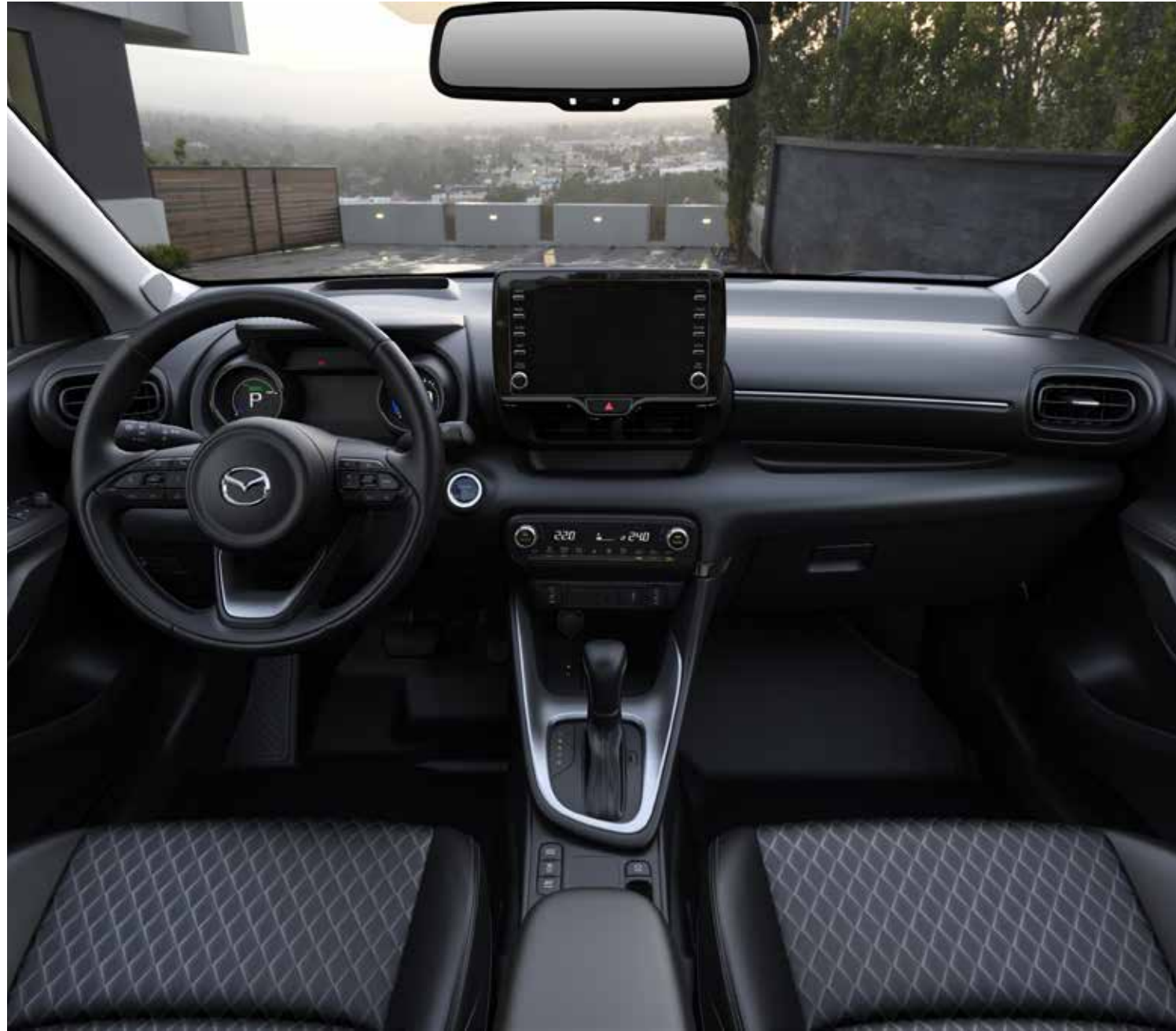
Intérieur Select: sièges avant sport avec revêtement en tissu/cuir artificiel noir, tableau d'instrumentation digital, climatisation automatique bi-zone et affichage tête haute en couleur avec projection sur le pare-brise