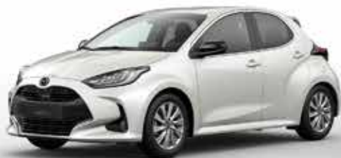
NORTHERN WHITE PEARL (48D)*