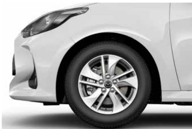
Jante 15" - Design 174 Silver