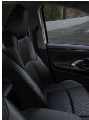
Sièges avant sport avec revêtement en tissu/cuir artificiel noir (SELECT)