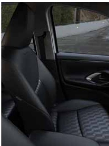
Sièges en tissu premium noir (AGILE)