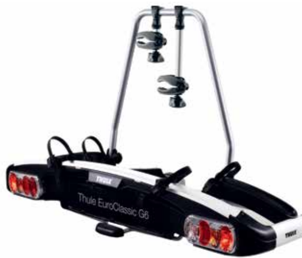
Thule porte-vélos pour e-bikes EuroClassic G6 928