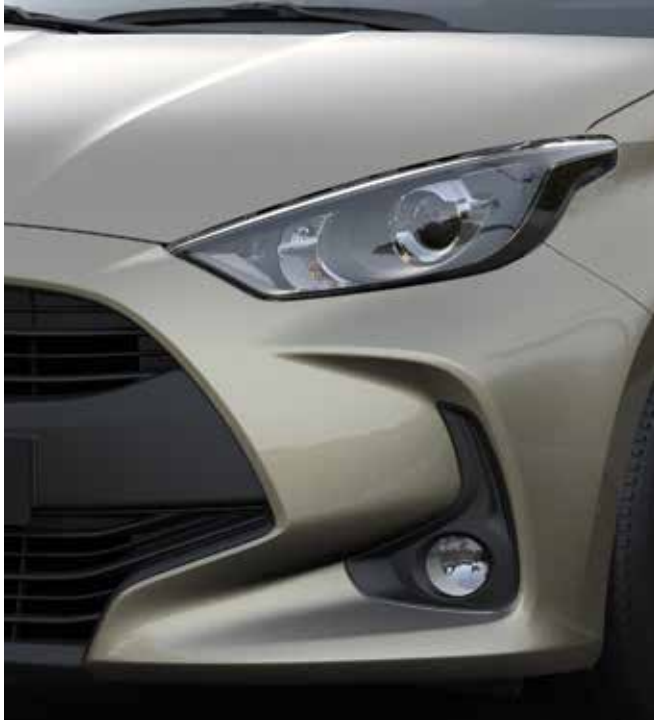
Phares antibrouillard halogènes