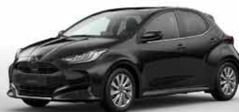
OPERA BLACK (49W)*