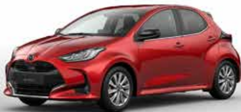
FORMAL RED (A9V)*