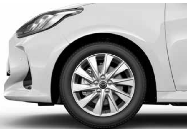
Jante 16" - Design 175 Silver