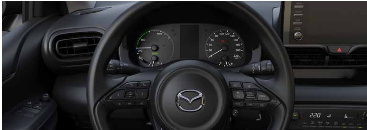
Tableau d'instrumentation analogique