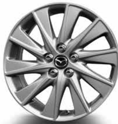
Jantes en alliage 16" et pneus 195/55 R16 (SELECT)