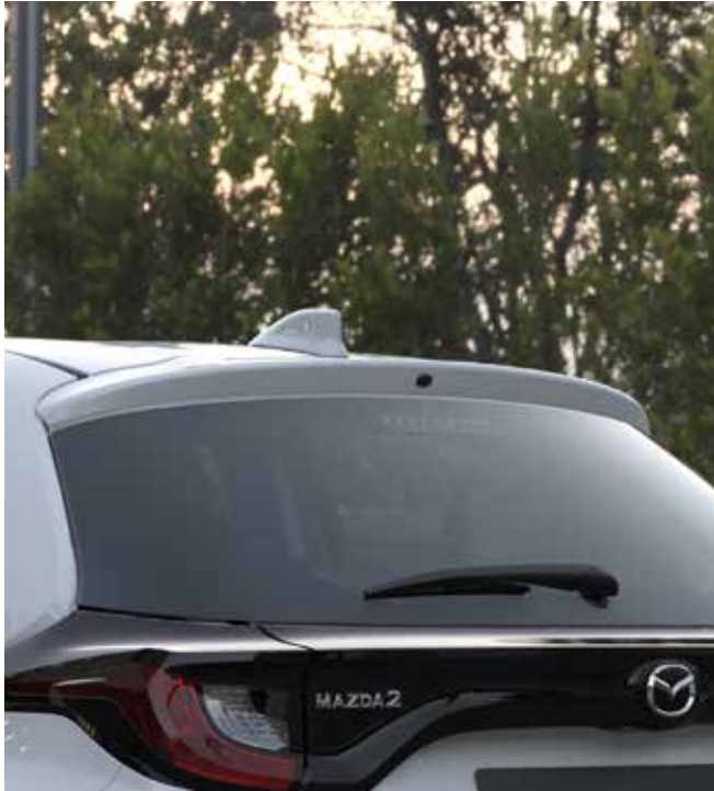
Antenne type requin