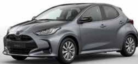
LEAD GREY (48G)*