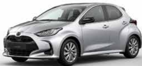
STORMY SILVER (49S)*