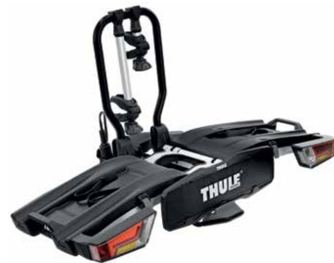
Thule porte-vélos EasyFold XT2