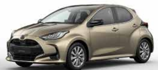
MONUMENT BRONZE (48H)*