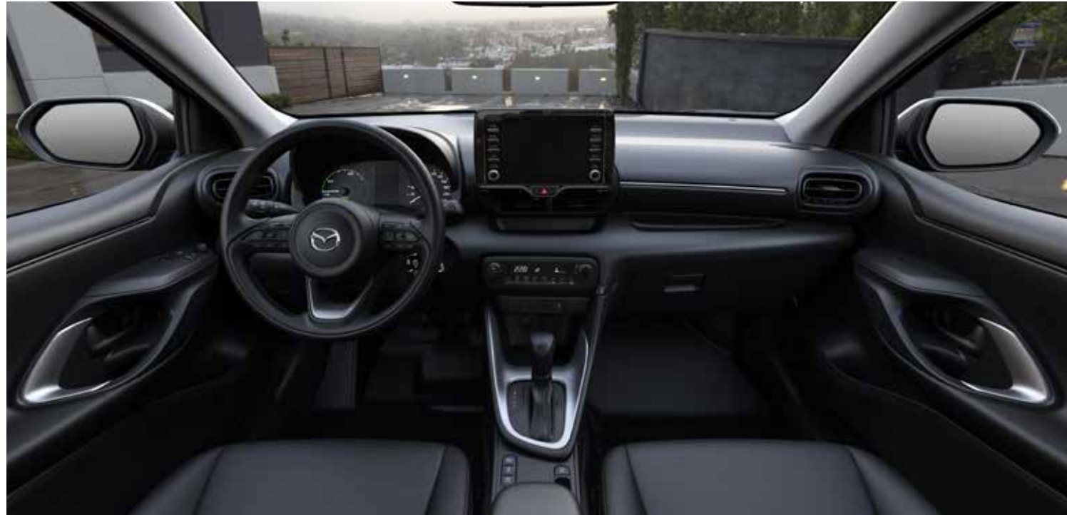
Intérieur Pure: revêtements des sièges en tissu noir, des panneaux de porte avant en feutre et système multimédia avec écran tactile en couleur 7"