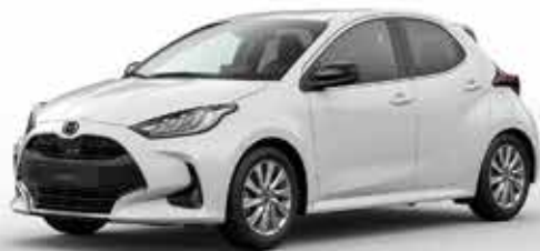
LUNAR WHITE (A8D)