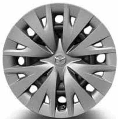
Jantes en acier 15" avec enjoliveur et pneus 185/65 R15 (PURE)