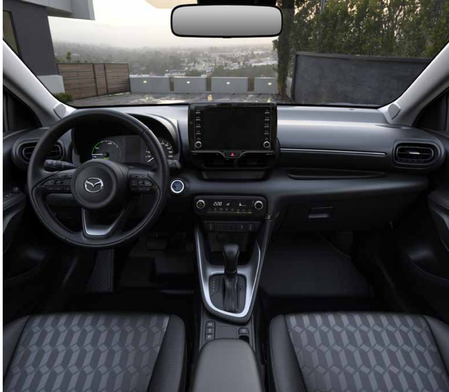
Intérieur Agile: revêtements des sièges en tissu premium noir, des panneaux de porte avant/arrière en feutre, volant et pommeau du levier de vitesse gainés cuir